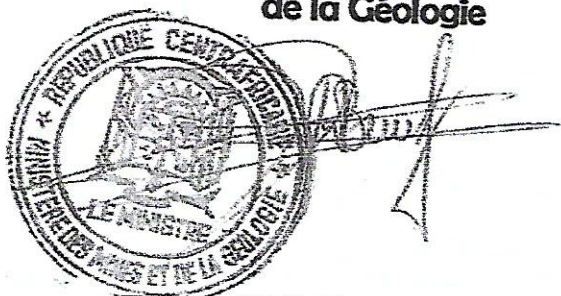
Rufin BENAM BELTOUNGOU

Le Premier Ministre, Chef du Gouvernement