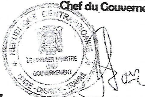
Henri - Marie DONDRA

Le Premier Ministre, Chef du Gouvernement